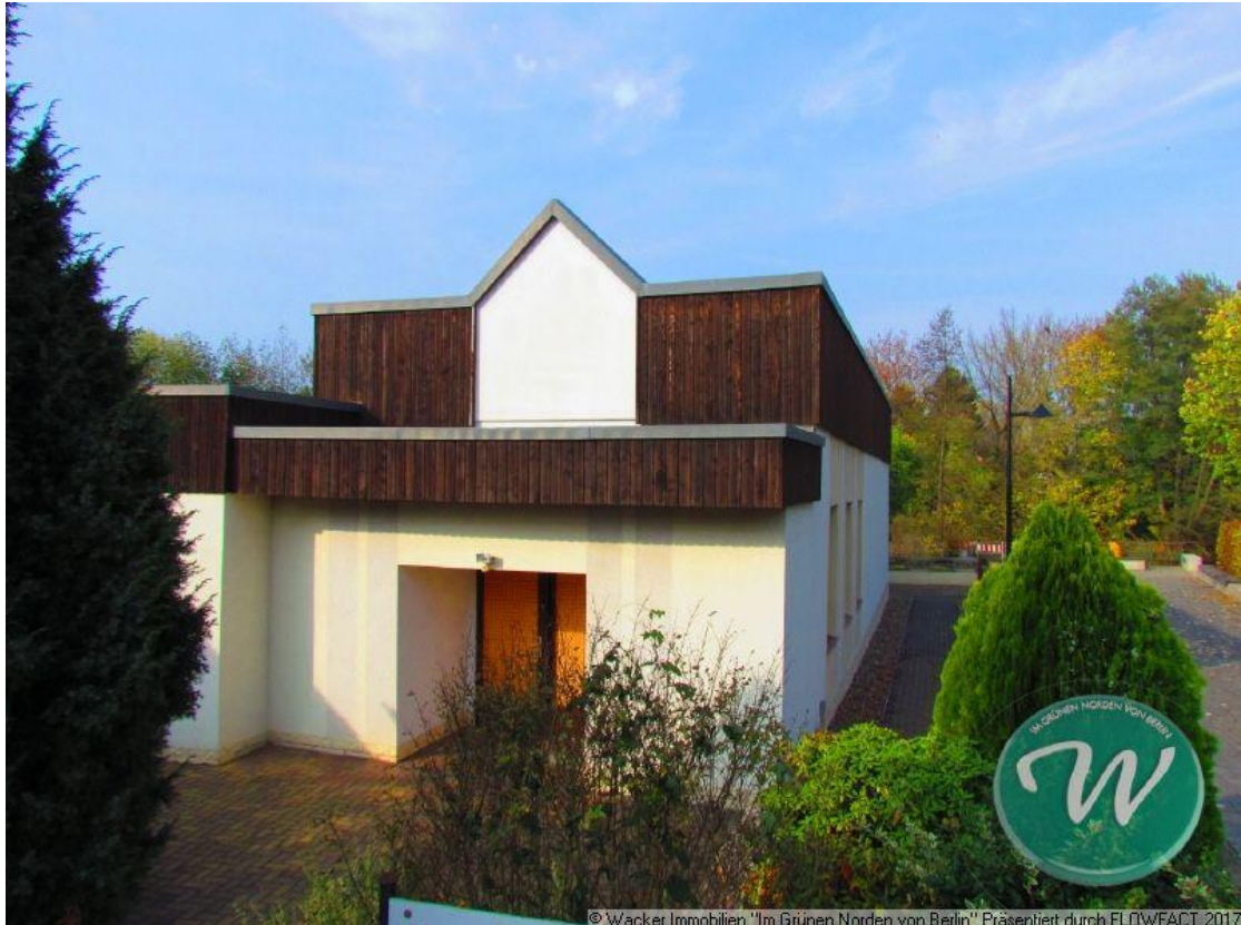
Blick auf die Liegenschaft