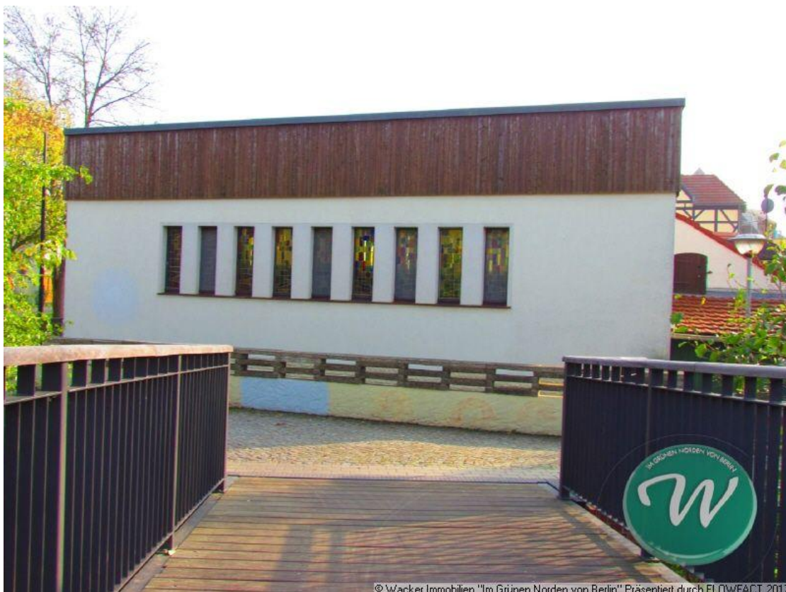
Vordere Ansicht vom Objekt

© Wacker Immobilien "Im Grünen Norden von Berlin" Präsentiert durch FLOWFACT 2017