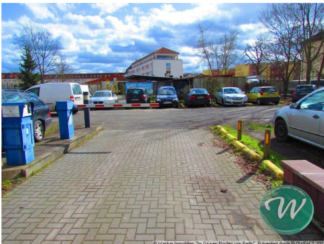
Grundstück - zum Teil Parkfläche

© Wacker Immobilien "Im Grünen Norden von Berlin". Präsentiert durch FLOWFACT 2017