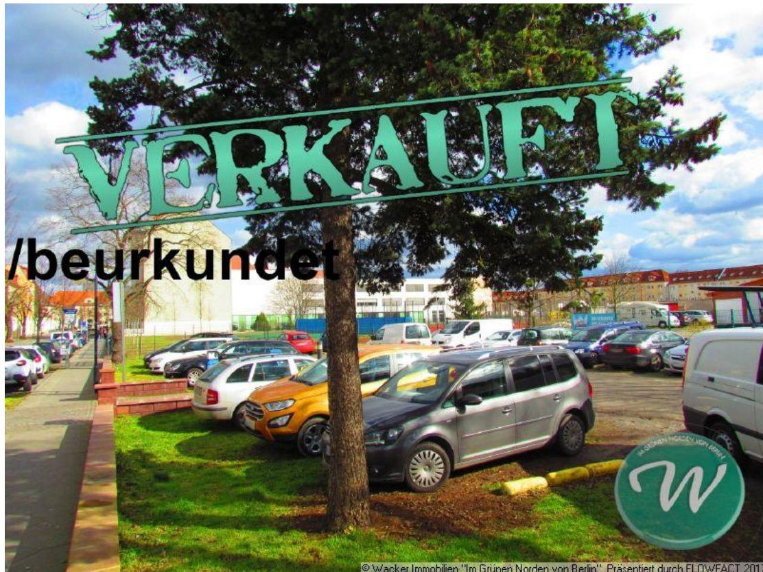
Grundstück - zum Teil Parkfläche